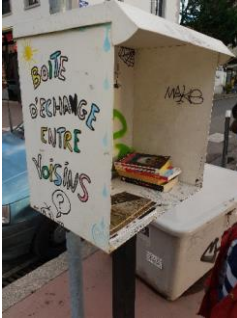
Boite à livres