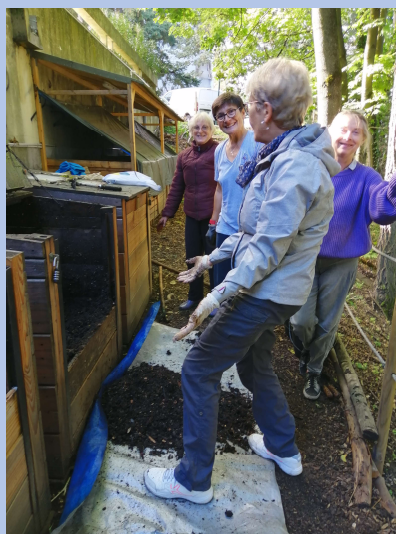
L'équipe COMPOST en pleine action