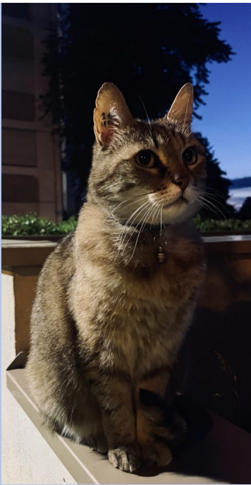
Chatte Zina dite Jeanne